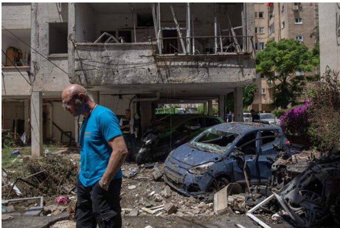
בית בפתח תקווה שנפגע מרקטה ששוגרה מרצועת עזה (מאי 2021).