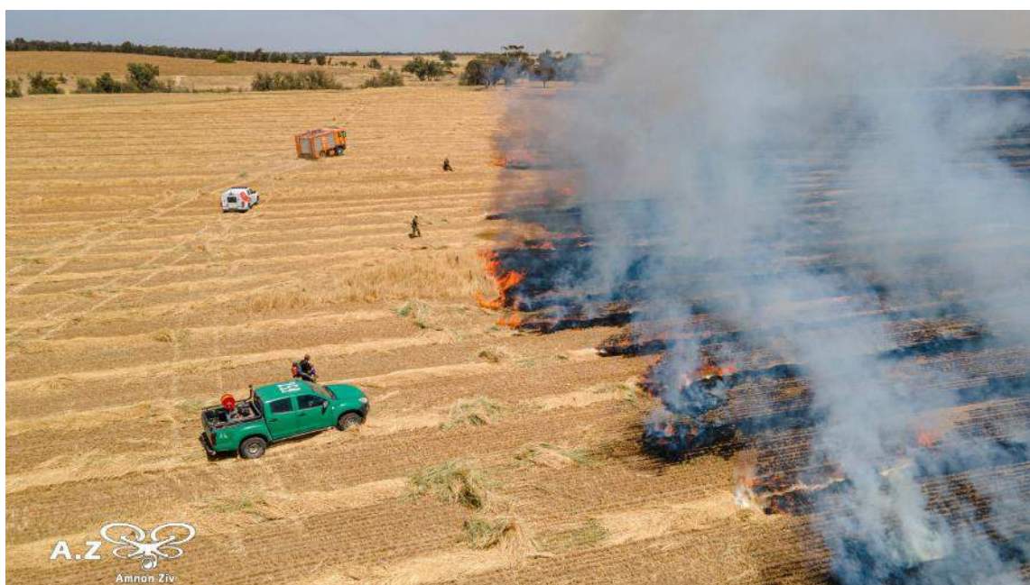
מתקפת בלוני תבערה, אזור אשכול, ישראל, 10 במאי 2021