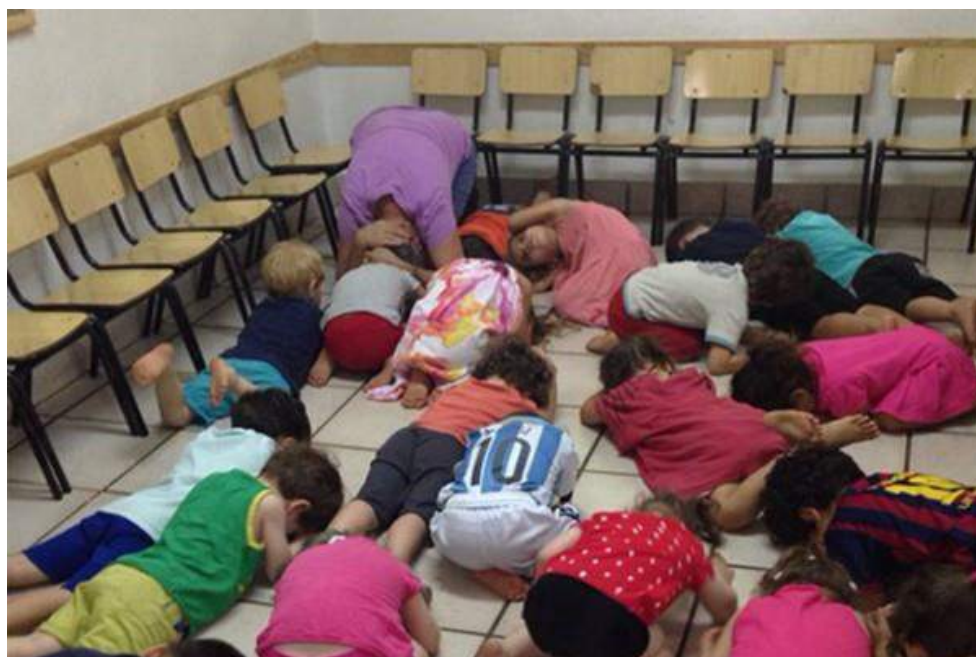
גן ילדים בדרום הארץ במהלך ירי רקטות מרצועת עזה.