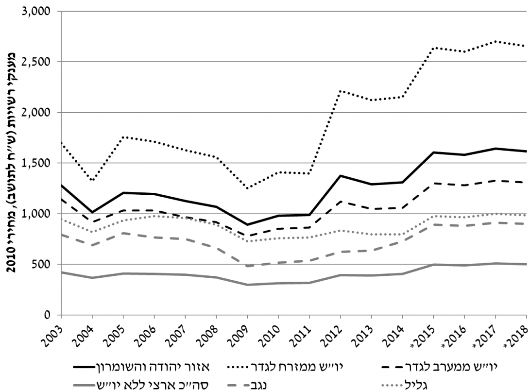
גרף מספר 2 – מענקים לרשויות מקומיות שו לתושב, 2003-2018

מקור: עיבודי מרכז מאקרו על נתוני קבצי הרשויות המקומיות של הלמ"ס 2003-2014 * עבור השנים 2015-2018 בוצעה תחזית על בסיס נתוני סעיף 18.11 בתקציב המדינה - העברות לרשויות מקומיות